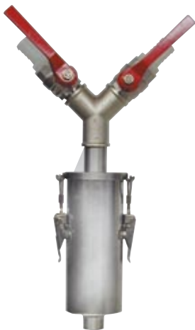
Filtro de red de 1'. 1' Net filter. Filtre de réseau 1'.