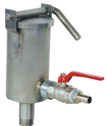
Filtro de red de 1' con cierre de palanca. 1' Net filter avec lever fastener. Filtre de réseau 1' avec fermeture levier.