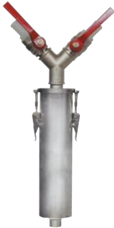
Deferrizador 1'. Iron remover 1'. Deferriseur 1'.

FILTRES ET CLÉS DE PAS POUR INSTALLATIONS DE DÉCUVAGE D'ÉMAIL