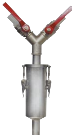
Filtro de red de 1' con imán. 1' Net filter with magnet. Filtre de réseau 1' avec aimant.