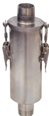
Filtro de cartucho con imán. Cartridge filter with magnet. Filtre de cartouche avec aimant.