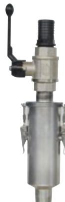
Filtro de 1¼' con imán. ¼' Cartridge filter with magnet. Filtre de cartouche d'1 ¼' avec aimant.